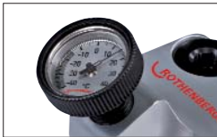
Большой термометр: надежное, контролируемое замораживание